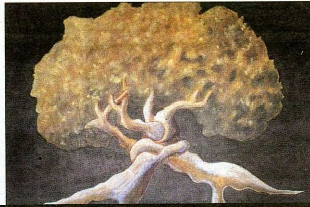
IMAGINATION. L'artiste peintre poursuit son œuvre en nous dévoilant les images qui peuplent les recoins de son intarissable imagination.